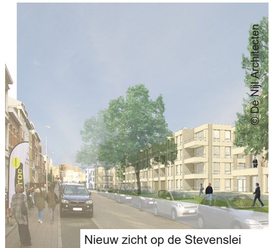
Nieuw zicht op de Stevenslei