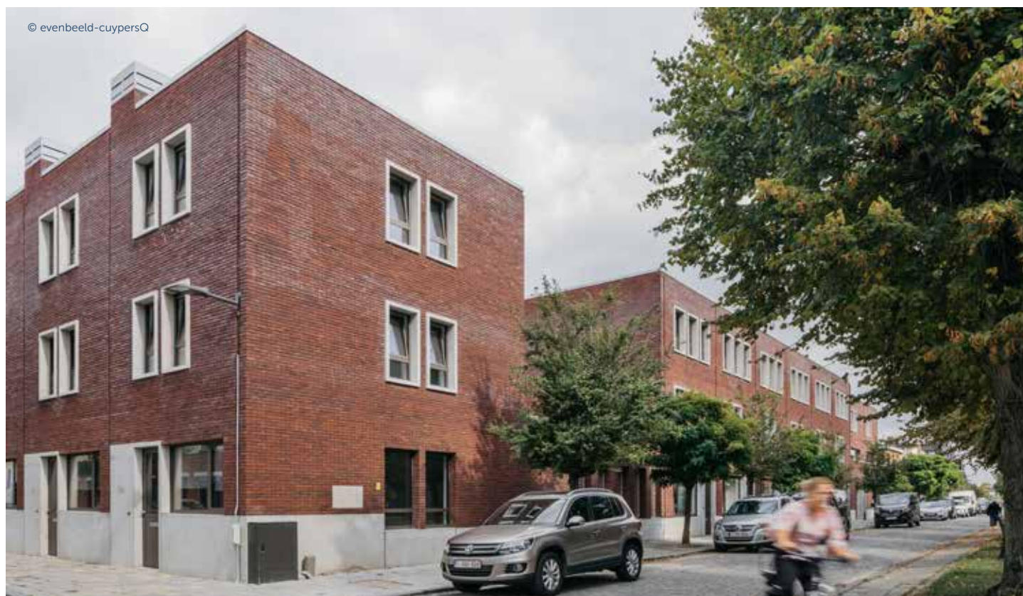
BOEKVELDPLEIN – UITSPANNINGSTRAAT (EENHEID)