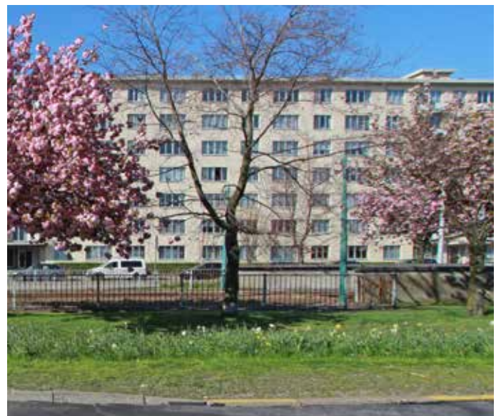
L. ZIELENSLAAN – BLANCEFLOERLAAN 26-40 FASE 4