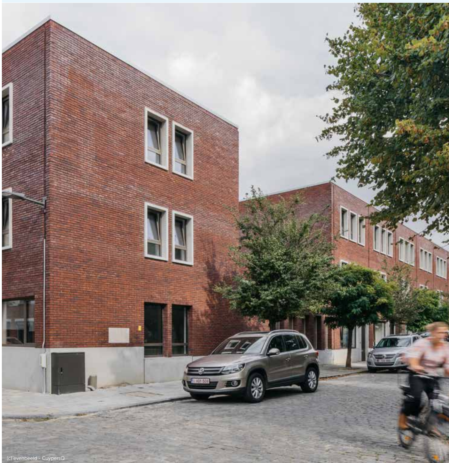
(c) evenbeeld - CuypersQ