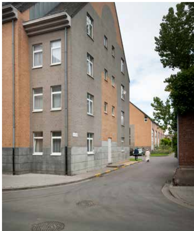
ST. BERNARDESEENWEG WAARLOOSHOFSTRAAT