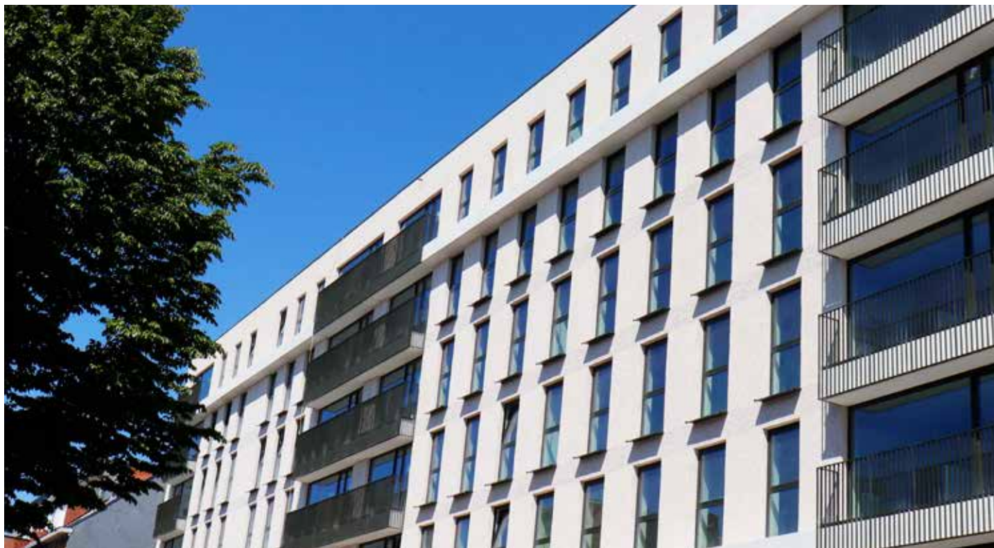
LANGE LOZANA STRAAT