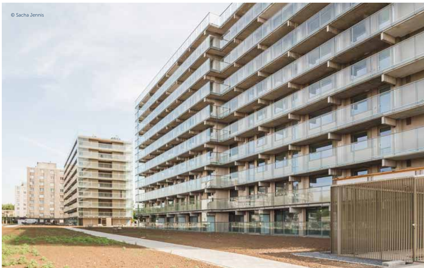
ROZEMAAI – JEF VAN HOOFSRAAT/KAREL CANDAELESTRAAT